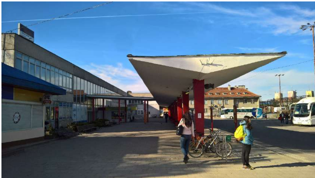
4. Widok na wiatę przy peronach dworca PKS i fasadę wschodnią części PKS.