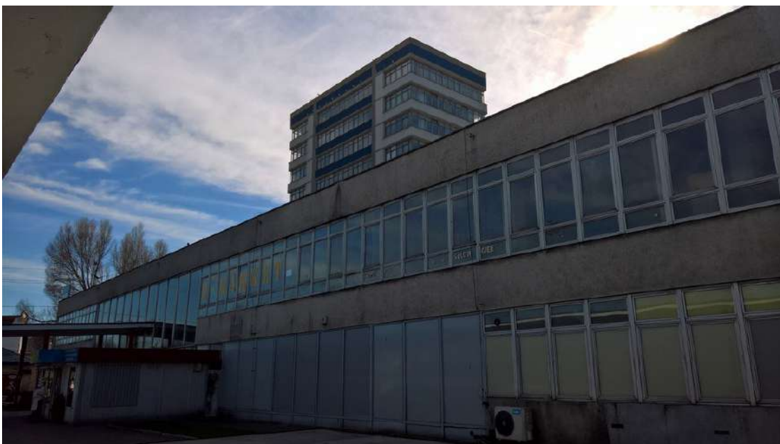
5. Elewacja części PKS od strony zatok autobusowych.