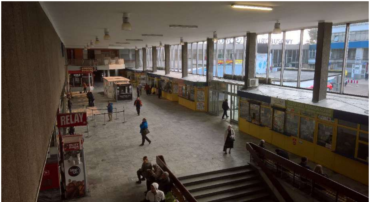
7. Hala PKP. Widok w kierunku południowo- wschodnim.