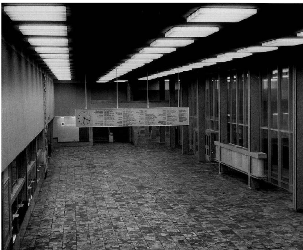
6. Widok wnętrza hali PKP w kierunku wschodnim ( fot. archiwalna ).