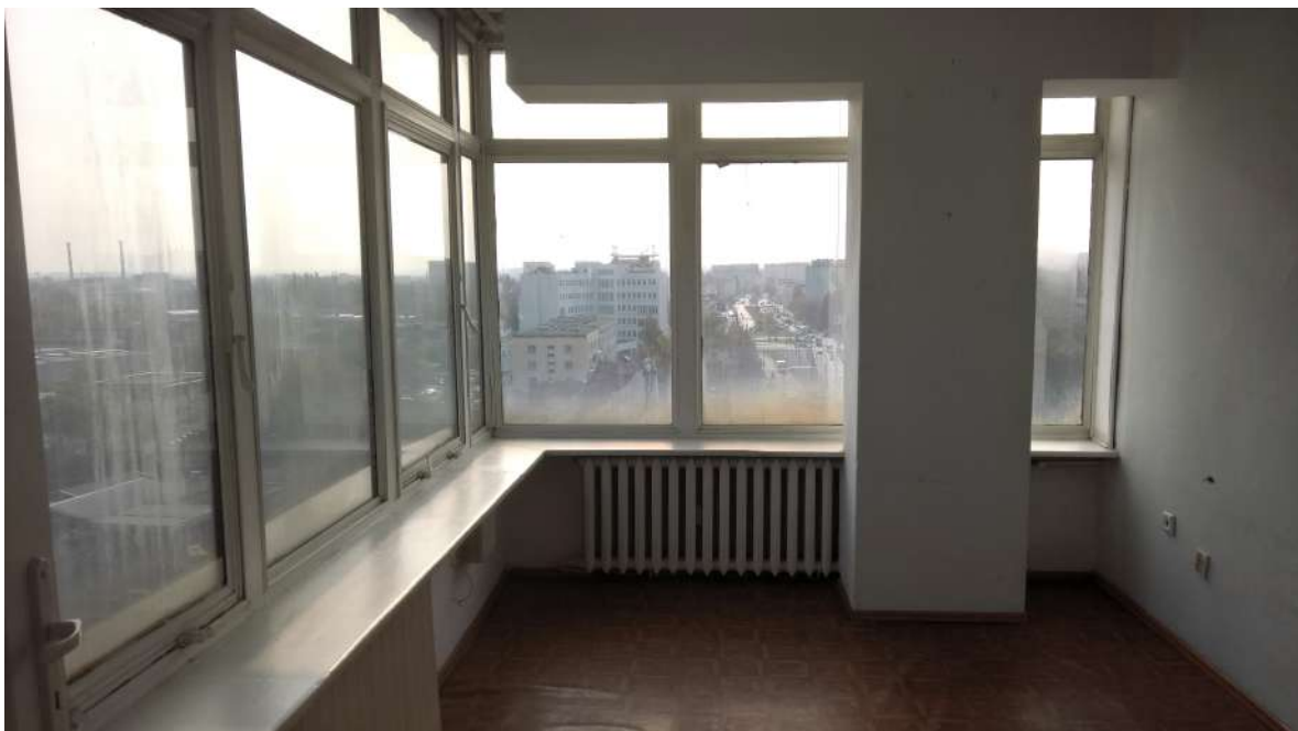
12. Okna narożne części biurowej wieży. Widoczny element konstrukcyjny w postaci prefabrykowanej ramy żelbetowej.