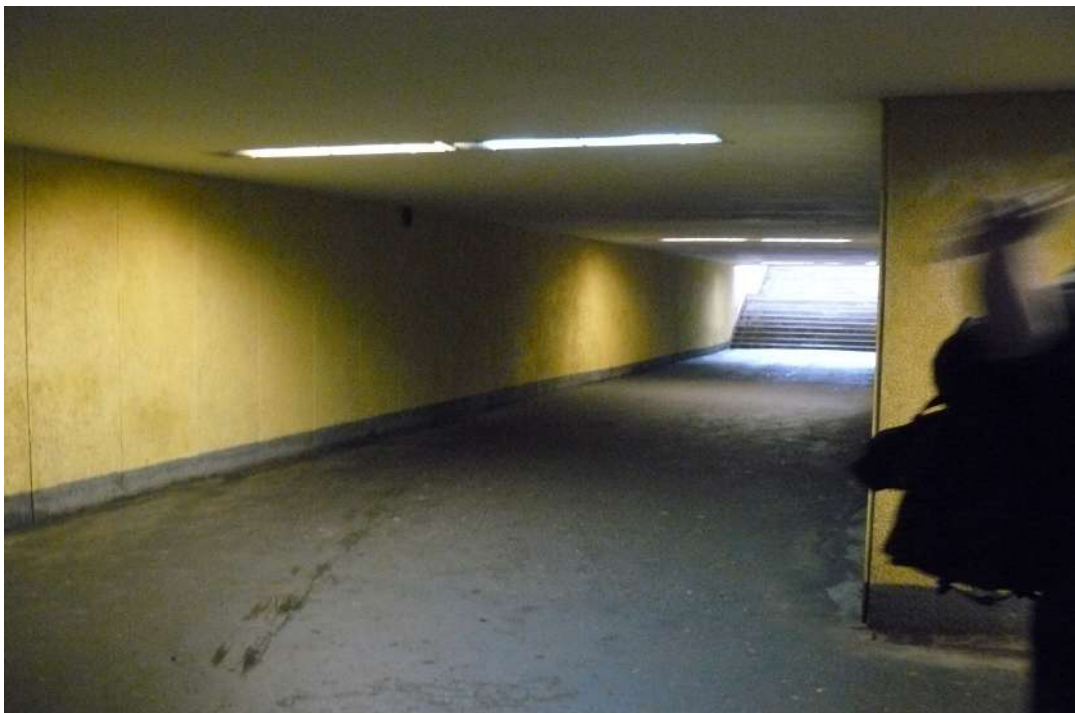
10. Widok tunelu z wyjściem na plac dworcowy i miasto (archiwum OWM SKZ).