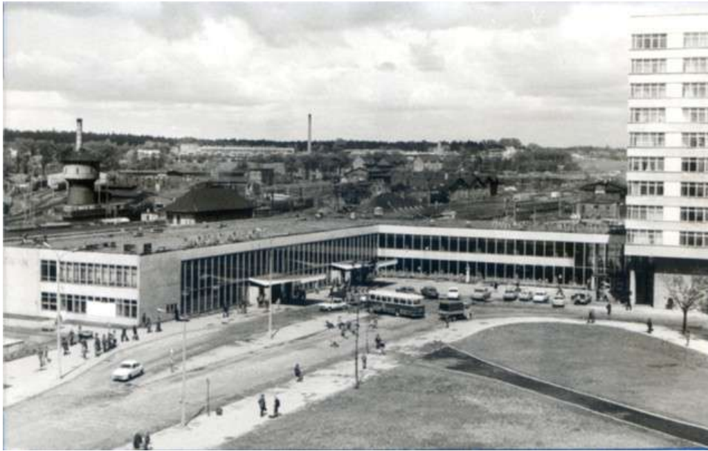
1. Widok ogólny zespołu Dworca Głównego w Olsztynie – lata 70-te (fot. archiwalna).