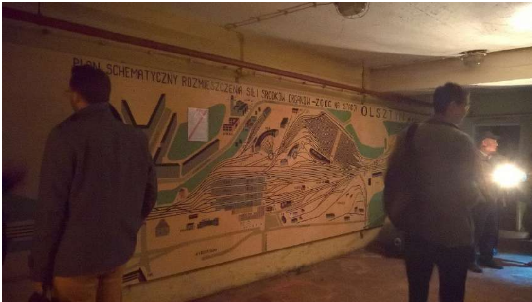
11. Widok wewnątrz schronu podziemnego.