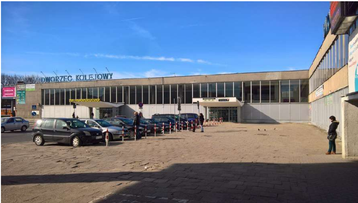
3. Elewacja części PKP od strony placu dworcowego.