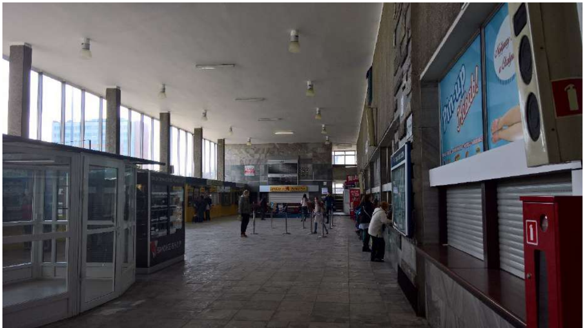
8. Hala PKP. Widok w kierunku zachodnim.