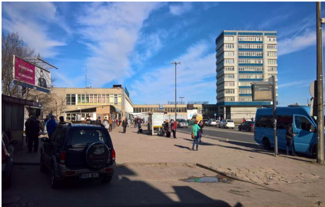
2. Widok ogólny budynków Dworca Głównego w Olsztynie współcześnie.