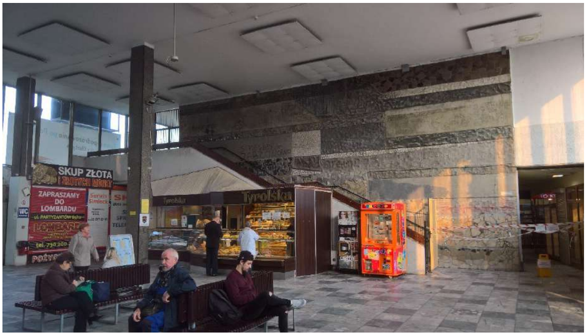
9. Hala PKS. Widok na ścianę północną.